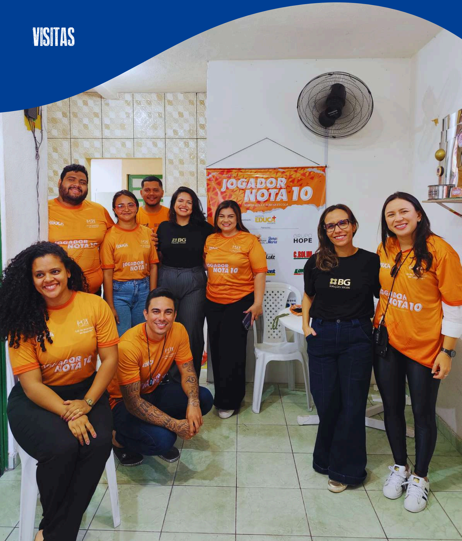
BG Soluções e Empresas Patrocinadores do Projeto Jogador Nota 10