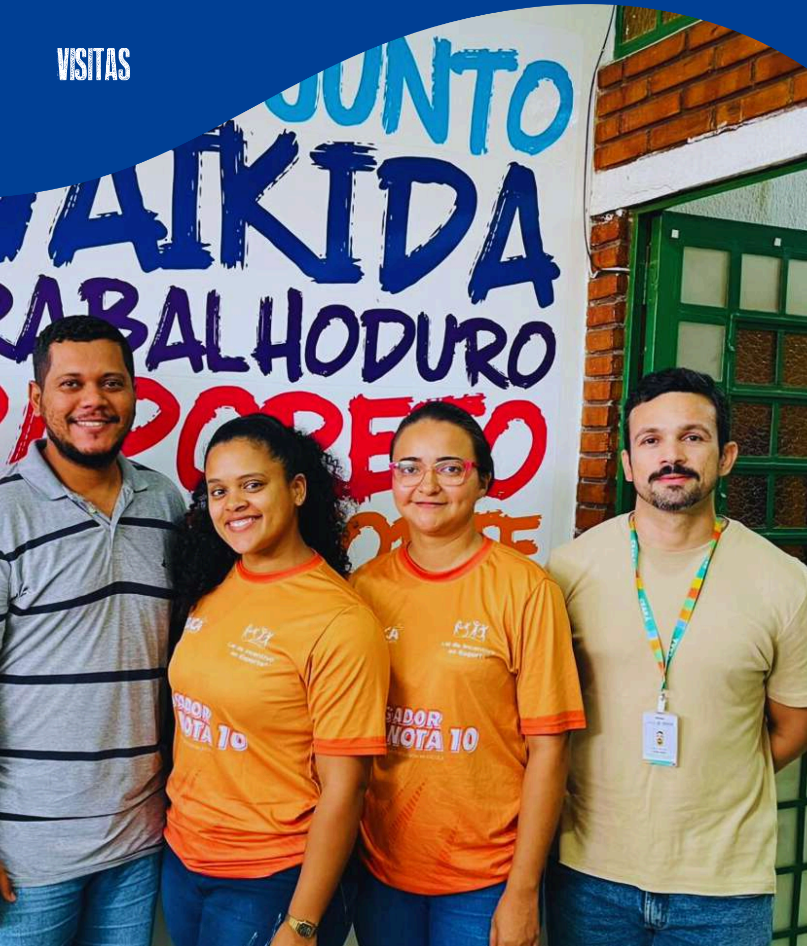
Superintendência do Sistema Estadual de Atendimento Socioeducativo (Seas)