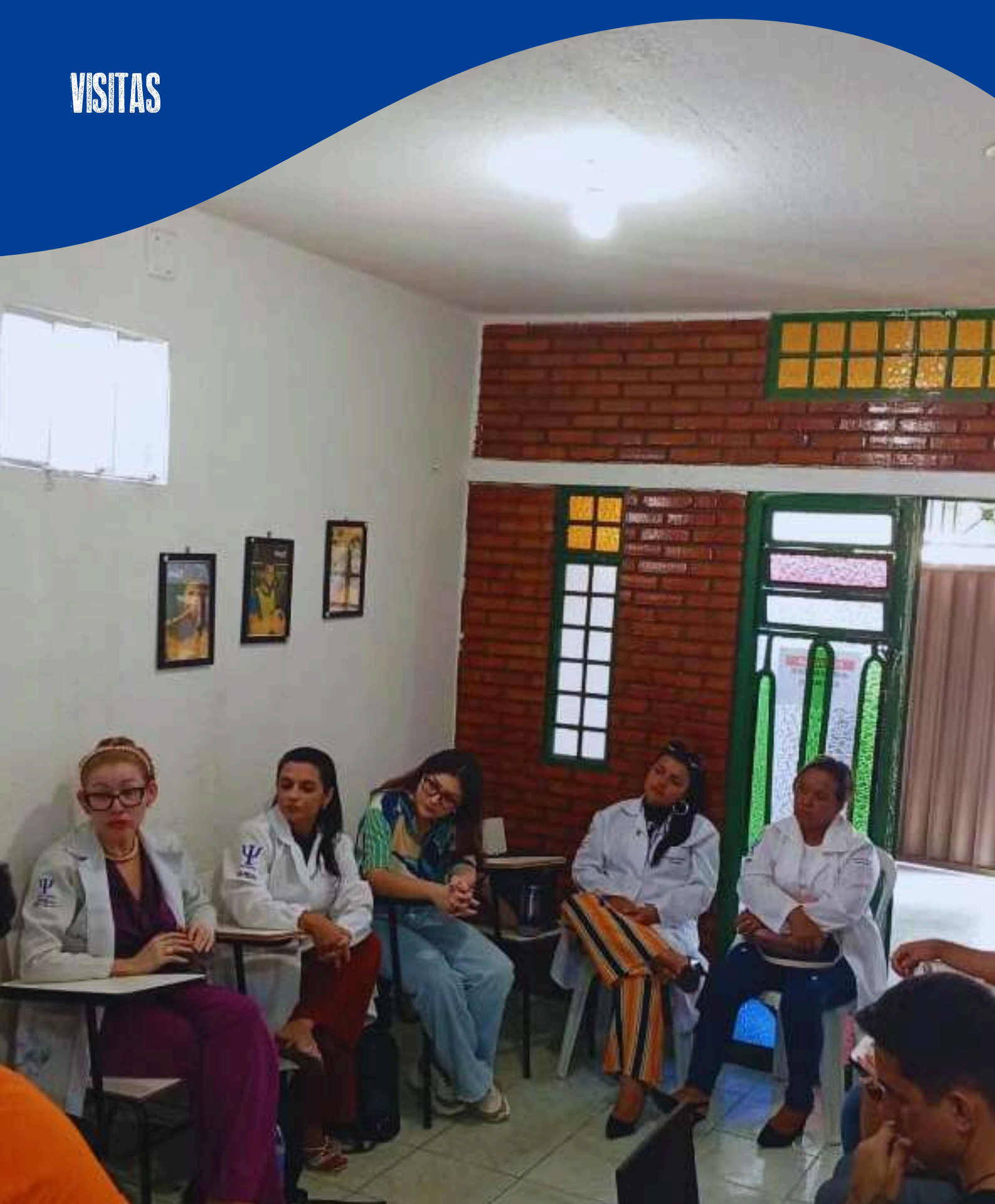
Projeto Ouvir-se e Grupo de Extensão de Arterapia da UNIGRANDE