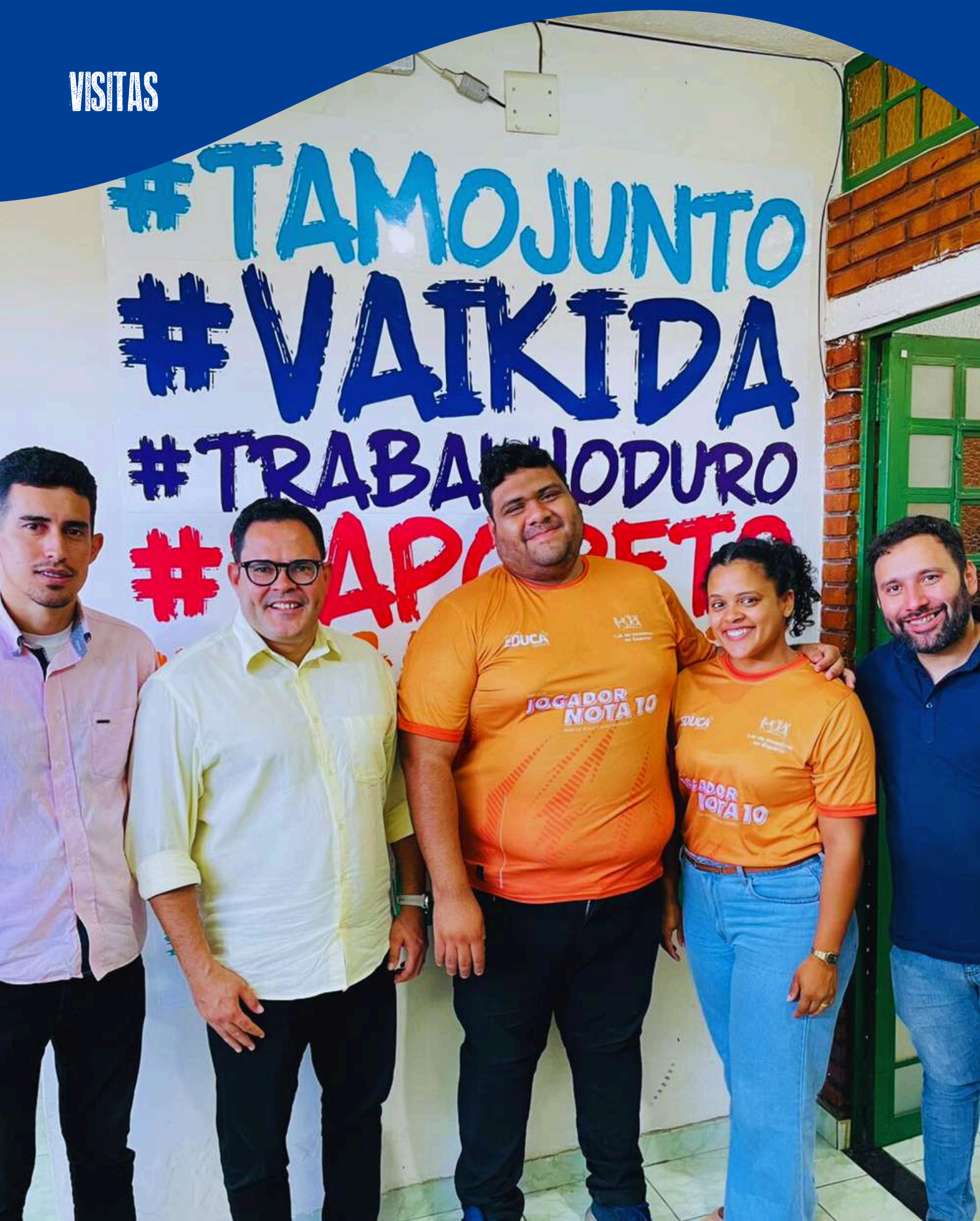
Secretaria da Proteção Social (SPS)