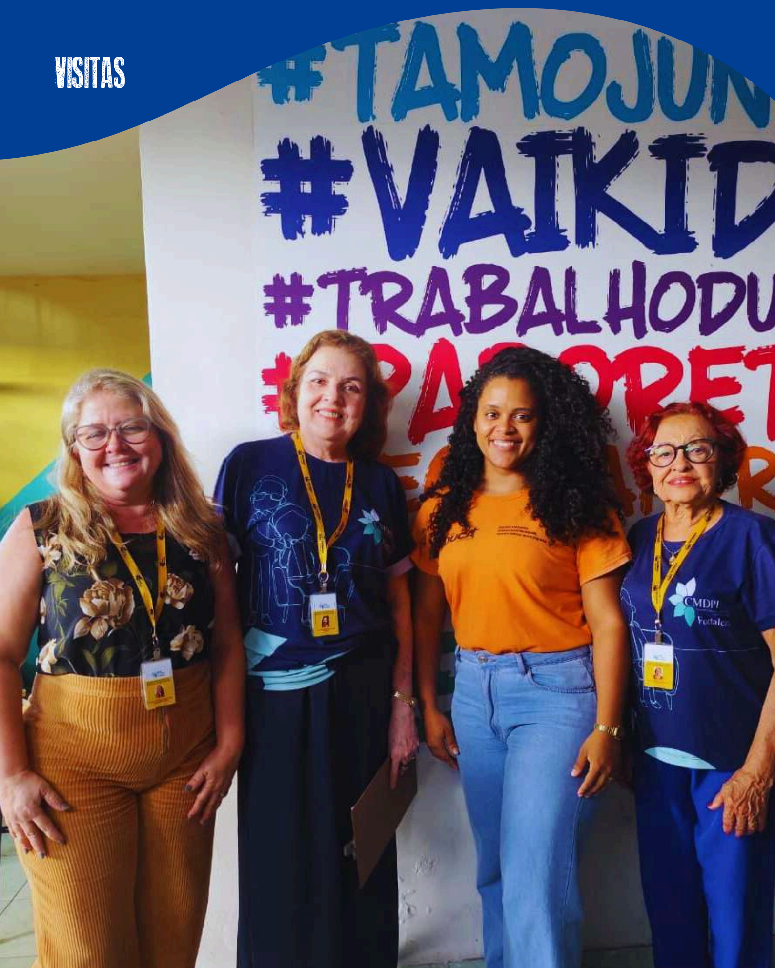
Conselho Municipal dos Direitos da Pessoa Idosa (CMDPI/CMDI).